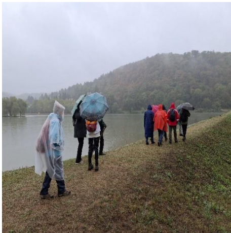
esőben a tavak körül