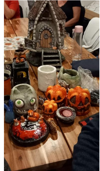
Szekeres Éva készítette újrahasznosított tárgyakból