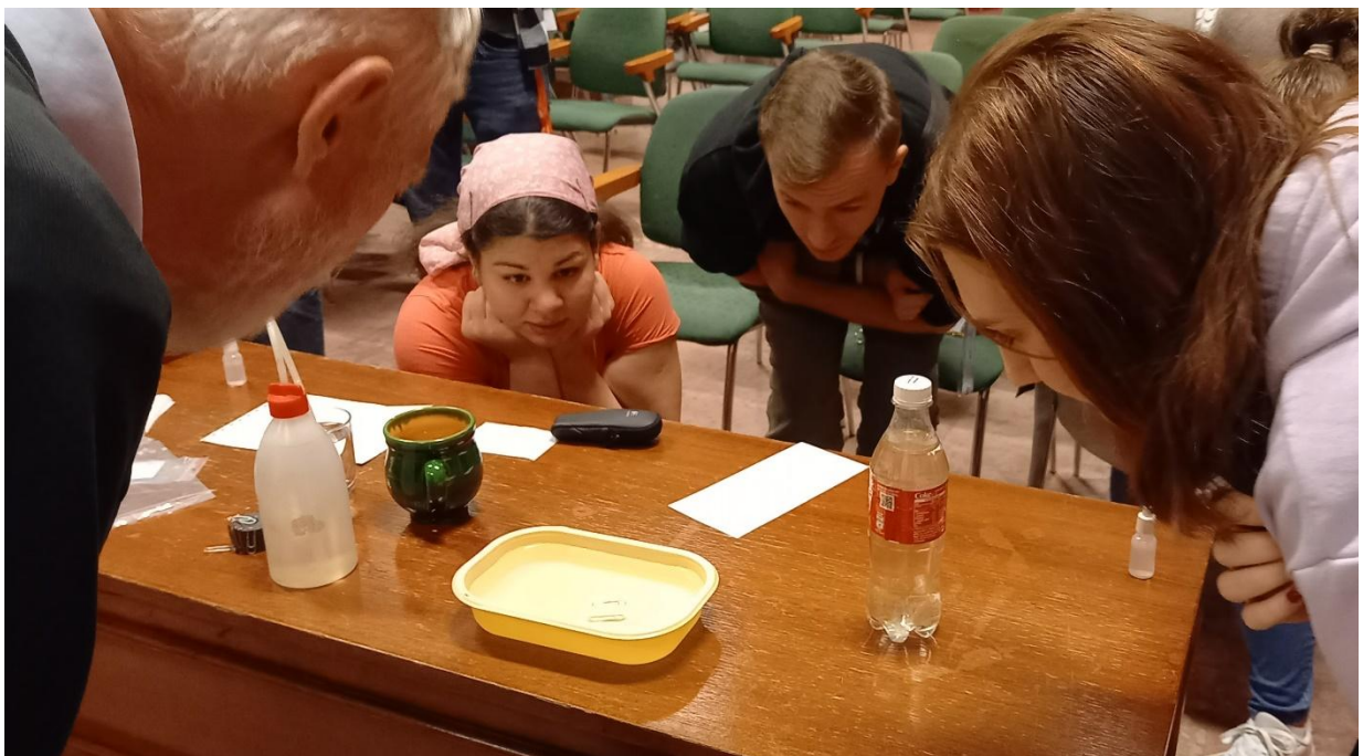
MATE Környezetvédelmi Szakkollégium