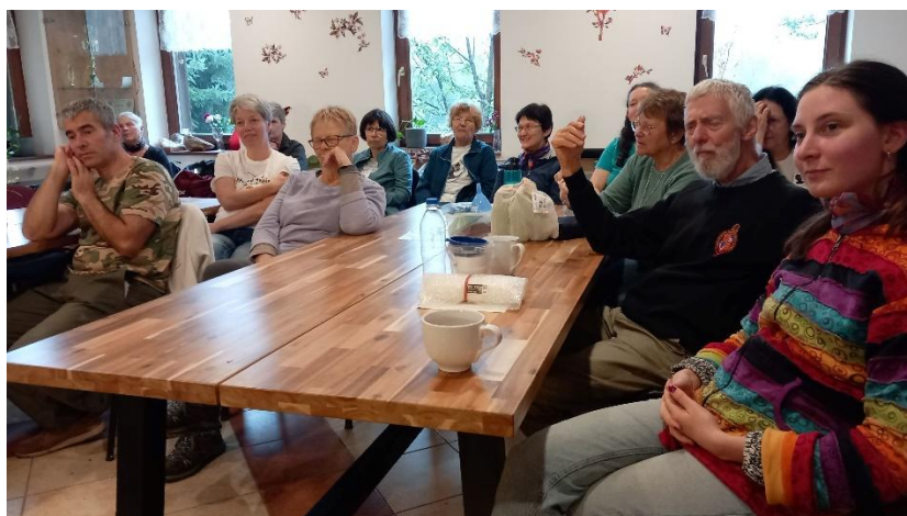
és figyelmes hallgatói