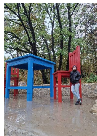
Szakadó esőben a Meseerdőben jártunk