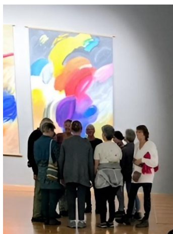
A Csontváry Múzeumban múzeumpedagógiai „órán”