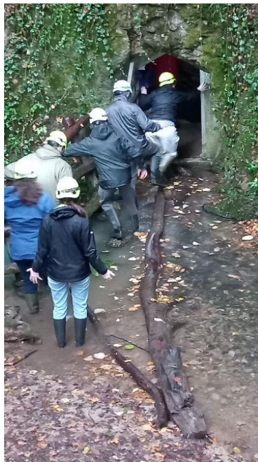
A barlang bejáratánál