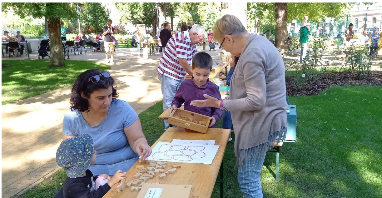
Autómentes nap a Hunyadi téren