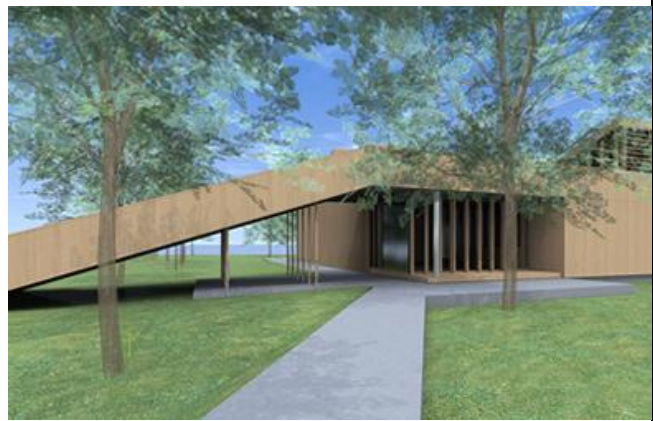
A Medvehagyma Ház vezetője és a Látogatóközpont