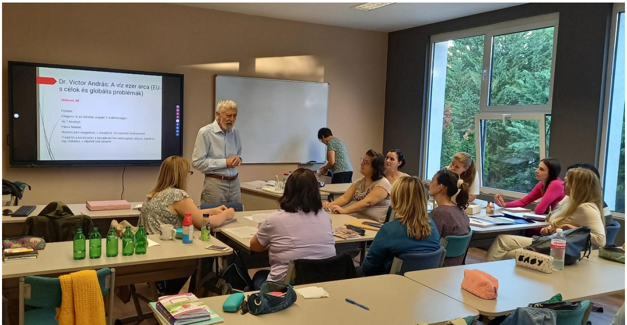
Milton Friedman Egyetem