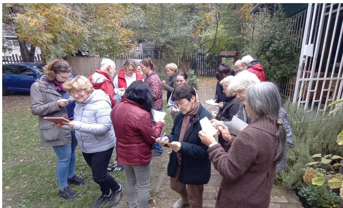
Víz vándortanösvény animátorképzés bent és kint