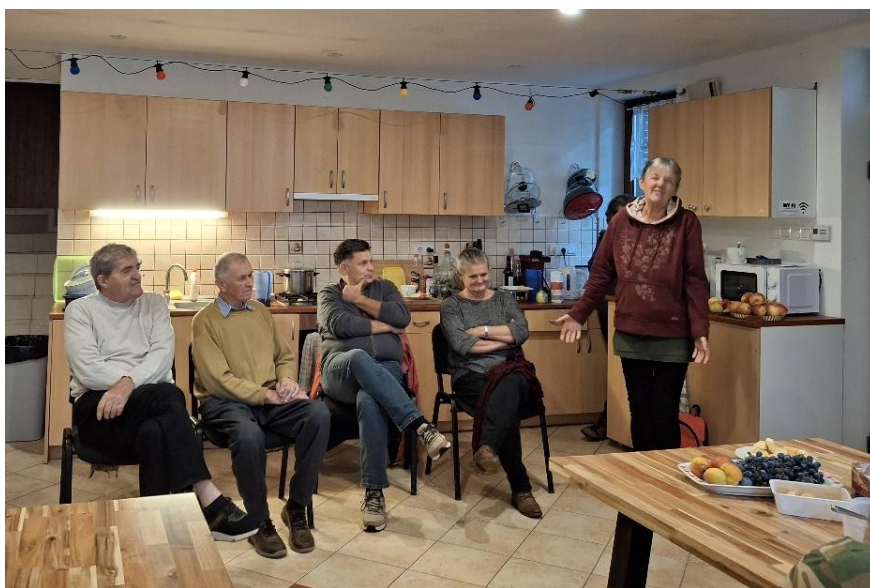
Az „élő könyvtár” vendégei