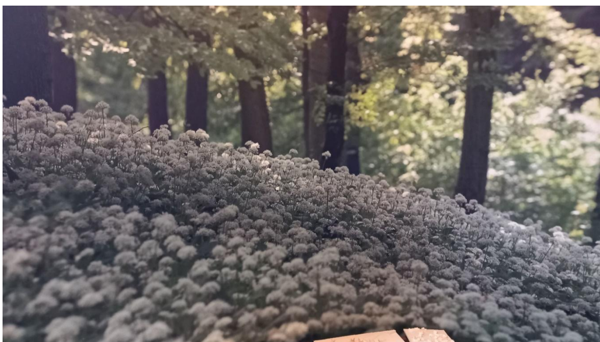
Medvehagyma a Mecsekben