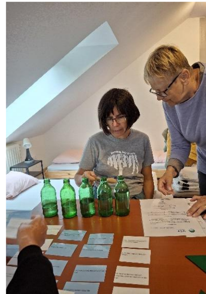
A Víz vándortanösvény bemutatásán