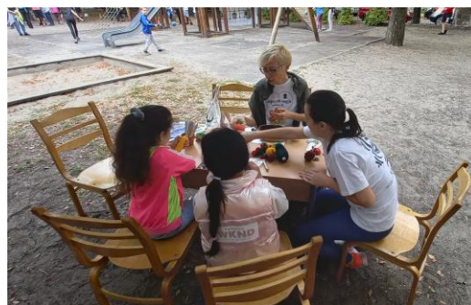
Paksi csapatok vizes és beporzós játékokkal