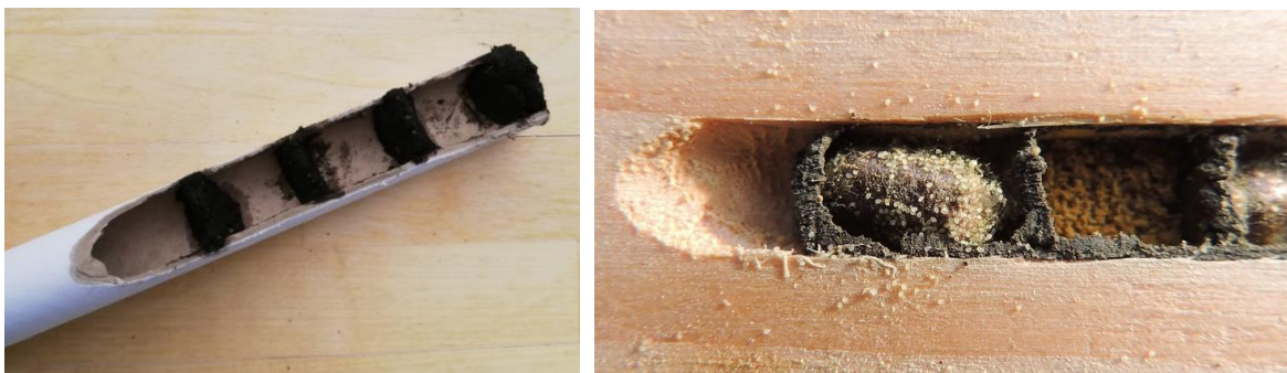
Felvágott folpackos gurigába nedves virágfölddel rögtönzött „bölcsők”, és faliméh kibontott bölcsői

Ha marad kész, sűrű sarunk, amiből gombócot lehet gyúrni, megpróbálkozhatunk azzal a „kalóz-kertész”, „kalóz-palántázó” gyakorlattal, hogy belekeverünk gombóconként pár szem virágmagot, és bedobjuk egy gazdátlan tünő kertbe, eldobjuk egy parkban, ahol nem nyírják hetente a gypet, egy járdaszigetre, ahol elhanyagolt a növényzet, vagy bárhová, ahol virágot szeretnénk majd látni. Kis szerencsével kikel és majd virágzik valamelyik mag – a kalózzá vált gyermek és a méhecskék öröme. https://hvg.hu/itthon/20070606_fkv_kozterulet_zold_vadmuvelet_raygun