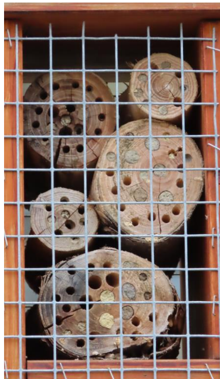
Különböző fajta sárral lefedett furatok egy rovarszállóban

Tehát keverjük kevés vizet kerti vagy réti, erdei földhöz, és tapasztaljuk meg, milyen lesz, mire lehet alkalmazni. Az úgynevezett földfestékeket is így nyerik, csak azokat sok vízből ülepítik ki. A méhszállók bejáratát elnézve, ahol márgásan vagy agyagosan sárga, barna és szürke sárral lefalazott furatokat is láthatunk, a méhek is többféle talajból nyerik a sarat. (Lehet, hogy egy helyen együtt fészkelő, más-más anya gyűjti a különbözőket?)