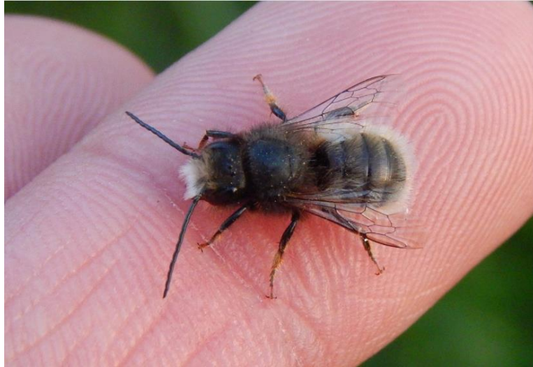
Vörös ...méh ( Osmia rufa ) – rokonságával 2023-ban az Év beporzói lettek.

Jobb oldalra kerüljön a MÉHEK szó, ezt csak egyszer kell kiraknod. Bal oldalra, egymás alá pedig a megoldások.