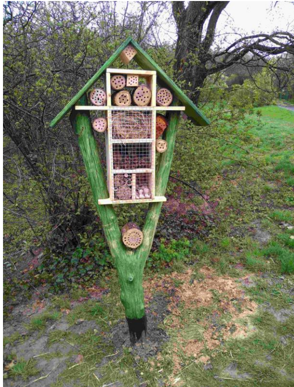
Méhszálló közparkban, változatos búvóhelyekkel

Készíthetünk komplex rovarszállót is, többféle töltékanyaggal, hogy az említett méheken kívül sokféle rovar és más ízeltlábú találhasson ott búvó- vagy költőhelyet. Láttam süniódúra emelt rovarszálló-építményt is a neten.