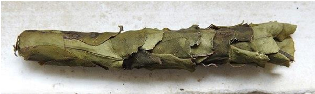
Egy cső kipreparált bélése.

Azt utánozzák, ahogyan a szabóméhek zöld levelekből kirágott, nagyjából ovális foltokkal kitapétázzák azt az üreget, csövet, amibe majd az utódjuk bölcsője kerül, vagy ha az üreg elég hosszú, akkor utódjaik bölcsői, szépen egymás után. Sziromlevelet is használhatnak.