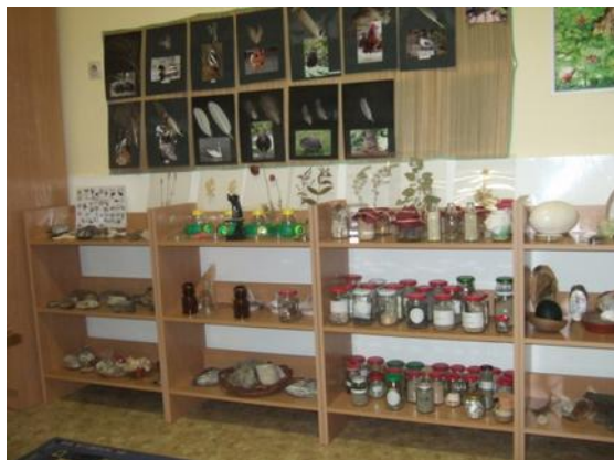
Termés-, kavics-, homok- és tojásgyűjtemény

- ami a mező élővilágát mutatja be; az erdő- és patakzsák a víz és a talaj vizsgálódásához nyújt módszertani segítséget a terepi megfigyelésekhez. Itt zajlanak a „madarász ovi” foglalkozások, amikor diavetítés van.