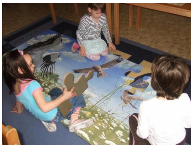
Óriás puzzle: a mező