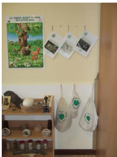
Erdő-, mező- és patakzsák a vizsgálódásokhoz élővilága