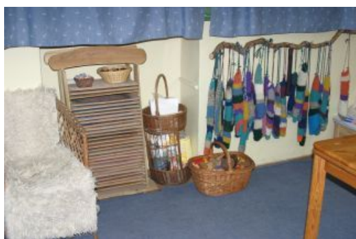
Rajztábla tartó és furulyák a gyerekek által kötött furulya tokokban.

Az óvodákat, az iskolákat minden évszakban beöltöztetik a gyerekek, a tanárok, a tanítók. A dekorációk nagy részét a gyermekmunkák és a gyűjtések teszik ki. A mi iskolánkban is a tantermek visszaadják az őszi kirándulások hangulatát. Néhány kép ízelítőül sajnos fekete-fehérben.