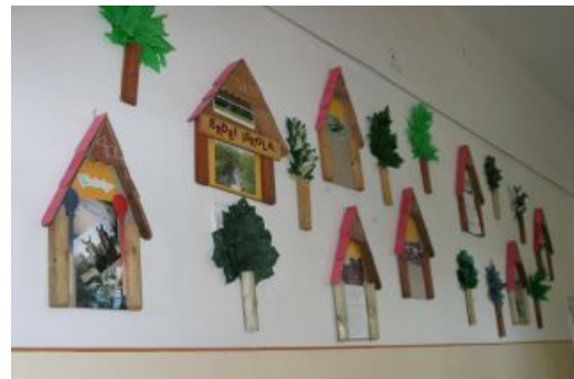
Erdei iskolák feldolgozása, az osztályok egy-egy házikóban való bemutatása a folyosón.

Nálunk a Kölcseyben már hagyománnyá vált az őszi bátorságpróba. Az idei egy kedves szülőt írásra ösztönzött. Az Ő kissé hosszúra sikeredett írását olvashatjátok.