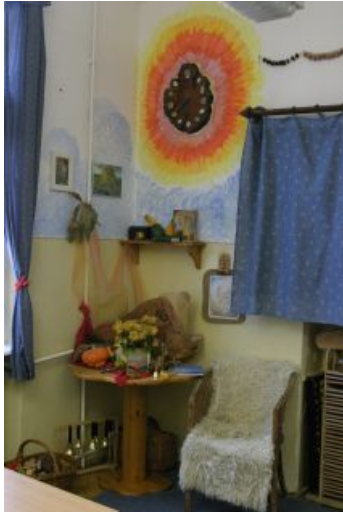
Egy meghitt sarok az osztályban.