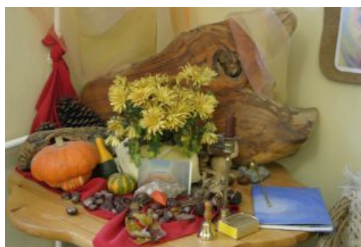
Csendélet őszi termésekkel, színekkel.