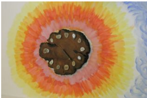
Napkorongos óra fa szeleten festett kavicsokkal.