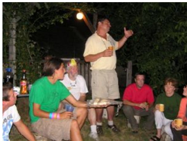
. Esti beszélgetés a polgármester dicsérő szavaival.