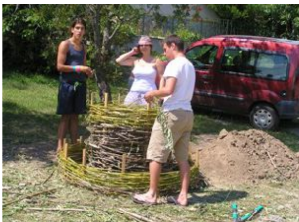
. Komposztka készül.