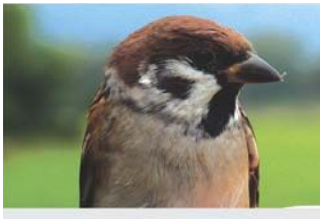
A mezei veréb torka fekete, fülfoltja is jól látható